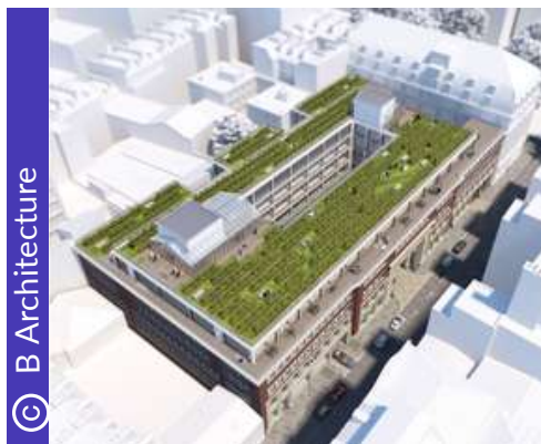
Rues Léon Jouhaux et Yves Toudic 75010 PARIS

Futur site de la CCI Paris Île-de-France (Jouhaux-Toudic)