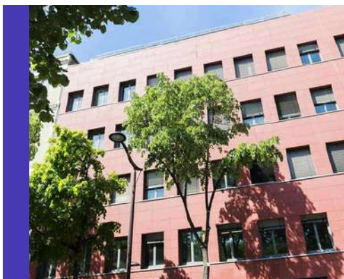
247 Avenue Gambetta 75020 PARIS

École LÉA-CFI de la CCI Paris Île-de-France