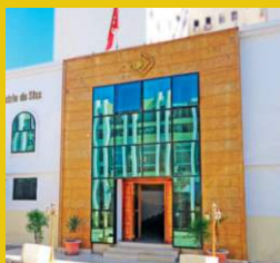
CCI de Sfax vue de face en 2023