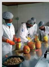
Cameroun Programme de formation des jeunes sur la transformation agroalimentaire