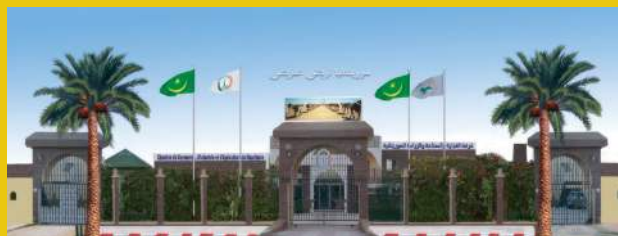
CCIA de Mauritanie, 2023