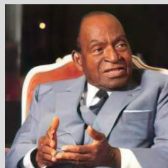
Félix Houphouët-Boigny (Côte d'Ivoire)