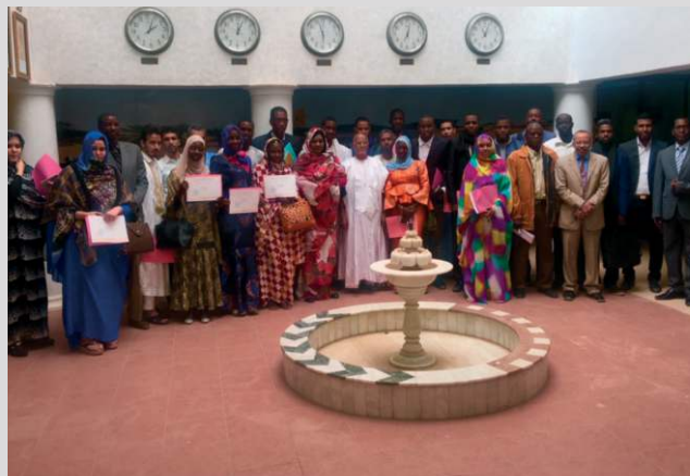
5 jours pour entreprendre Compagnonnage CCI Marseille-Provence CCIA de Mauritanie