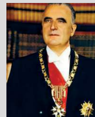
Georges Pompidou (France)