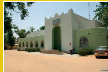
CCIAMA du Tchad, 2022