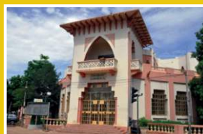
CCI du Mali vue de face, 2023