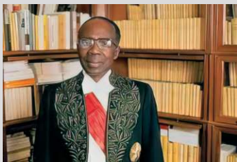
Léopold Sédar Senghor (Sénégal)