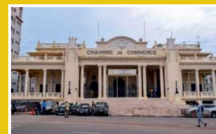
Photo de l'actuelle CCI de Dakar, prise le lundi 25 septembre 2023