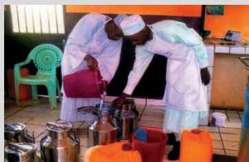
Cameroun Filière Elevage_Lait Projet Profor