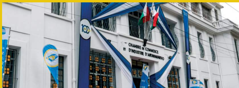
CCIA d'Antananarivo, 2023