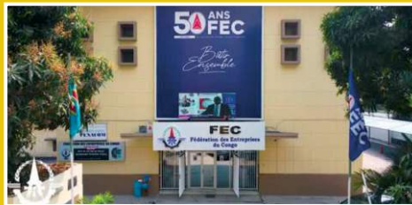
FEC, République démocratique du Congo