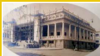
Chambre de Commerce, d'Industrie et d'Agriculture datant de 1924