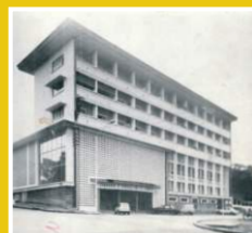
Chambre d'Agriculture de Côte d'Ivoire de la façade du bâtiment extraite des archives datant de 1925