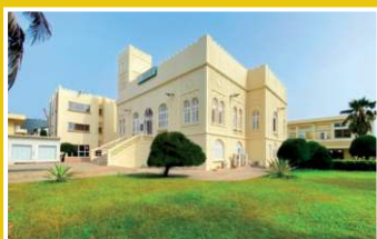
CCI du Bénin, 2023

Bénin, Burkina Faso, Cap Vert, Côte d'Ivoire, Guinée, Guinée Bissau, Mali, Niger, Sénégal, Togo