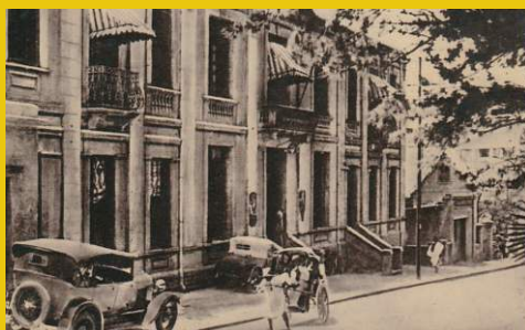
CCIA d'Antananarivo, 1930