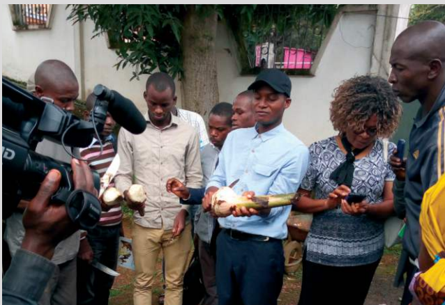
Interview des cadres en formation