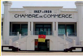
CCIMA du Cameroun, 2023