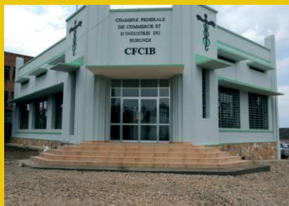
CCI du Burundi, 2023