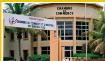
CCI du Burkina Faso, 2023