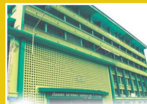
Chambre d'Agriculture de Côte d'Ivoire, image récente prise en 2022