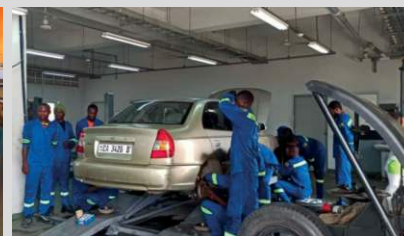
Cameroun Réparation automobile Projet de formation des jeunes