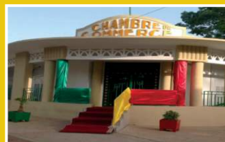
CCIA de Thiès (Sénégal), 2023