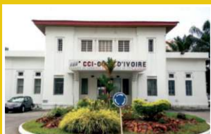
CCI de Côte d'Ivoire, 2023