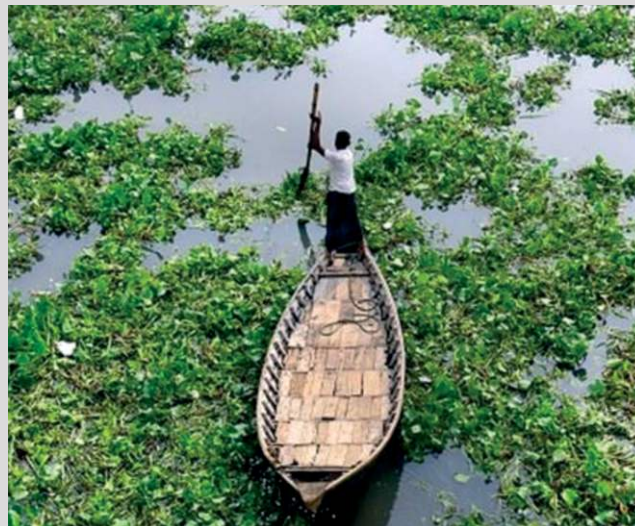
Prix de l'Entrepreneur responsable Franco-fil 2020 au service de l'agroéconomie durable

EcoPlus est spécialisée dans la fabrication et la mise à disposition de la population de sacs biodégradables produits à base de fibres de bananiers, pour remplacer les emballages plastique