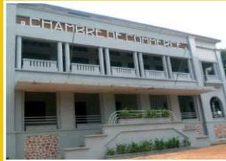
CCIMA de Centrafrique, 2021