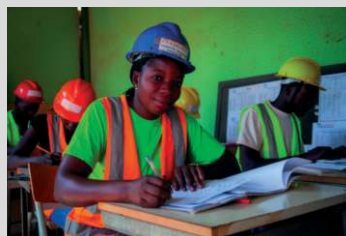
Burkina Faso Etudiants en BTP Projet RIPAUQUE