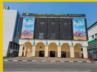
CCI du Djibouti, 2023 (photo Yacin Houssein)