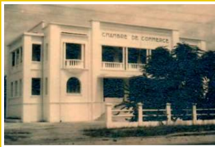
CCIAM de Pointe Noire de 1950 jusqu'à 2022