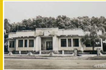
CCIAM de Brazzaville, 1950