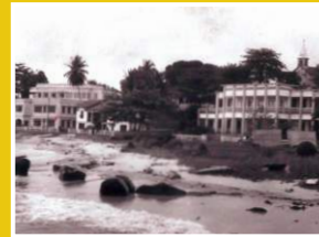
CCI du Gabon vue de face datant de 1965