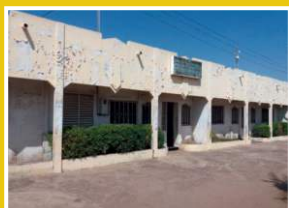
CCIA de Diourbel vue de face en 2023