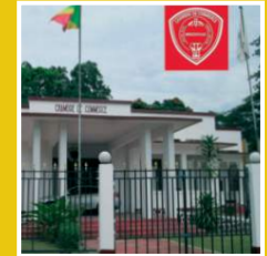
CCIAM de Brazzaville, 2023