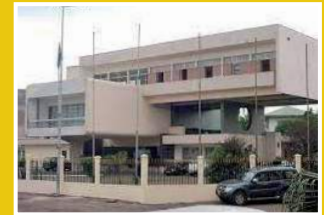
CC du Gabon, 2023