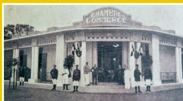
CCIA de Thiès (Sénégal), 1939